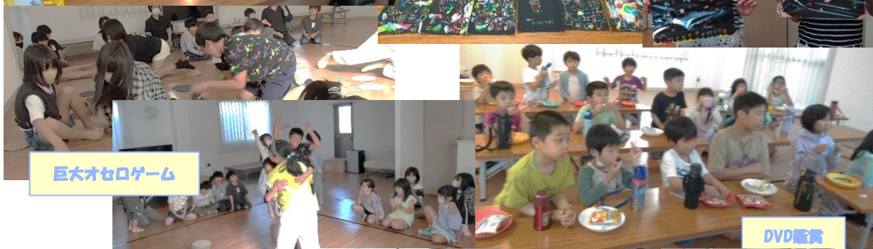
巨大オセロゲーム